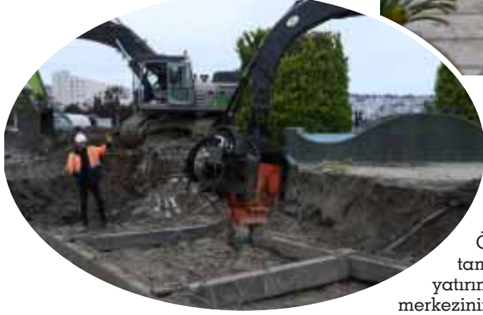
getirilecek. Çalışmalara Mert Irmağı kenarında

KENT genelinde altyapı yatırımlarını aralıksız sürdüren SASKİ, Atakum sahilindeki çalışmaların ardından bu kez şehir merkezinin en önemli atık su taşıyıcı sistemlerinden birini yeniliyor. Toplam 2 bin 450 metre uzunluğundaki hattın bin 950 metresi tamamlanırken, kalan bölümde çalışmalar yoğun şekilde devam ediyor. 2 bin milimetre çapındaki betonarme borularla inşa edilen proje sayesinde şehir merkezinin ana atık su taşıma kapasitesi artırlacak, altyapı sistemi daha güvenli ve dayanıklı hale