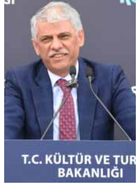
T.C. KÜLTÜR VE TURİZM BAKANLIĞI

Samsun'da düzenlenen Türkiye Kültür Yolu Festivali'nin açılışında konuşan Kültür ve Turizm Bakan Yardımcısı Nadir Alpaslan, "Bizler inanıyoruz ki; kültür, bir milletin en güçlü hafızasıdır. Bu hafızayı korumak, geliştirmek ve dünyaya anlatmak bizim en önemli sorumluluğumuzdur" dedi