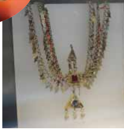
kuyumculuğu, diğer sanat alanlarında olduğu gibi Türk-İslam

ve Anadolu sanat sentezi ile karakterizedir. Osmanlı'nın farklı kültürler ve komşularıyla etkileşimi, kuyumculuk alanında da görülmüştür. Osmanlı kuyumculuğunu ve takı modellerini, başlangıçta Bizans, Selçuklu, İran, Arap, Çin ve daha sonra Rus ve özellikle Avrupa ile gelişen ilişkiler etkilemiştir" ifadeleri yer alıyor. Vatandaşlar tarafından oldukça fazla ilgi gören bölümde sergilenen kuyumculuk eserleri arasında altın, gümüş ve çeşitli madenlerden oluşan tepelik, bilezik, ahlık, kolye, gerdanlık, küpe, bileklik, kolye ucu, muska gibi birçok eser bulunmaktadır.