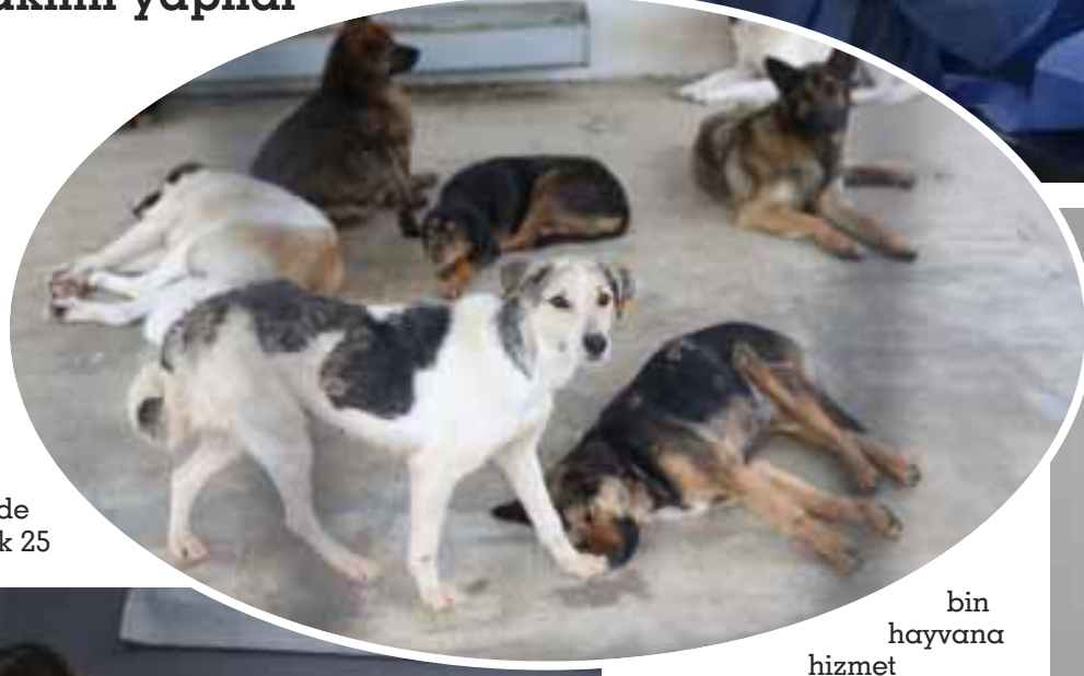
bin hayvana hizmet

Merkezde 2019'dan bu yana 14 bin 844 hayvanın kısırlaştırıldığını ve günlük ortalama 40 hayvana bu operasyonun yapıldığını belirten Karabay, "Merkezimizde 2019 yılından bu yana yaklaşık 25