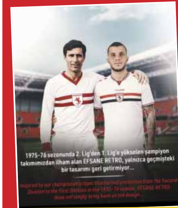
1975-76 sezonunda 2. Lig'den 1. Lig'e yükselen şampiyon takımımızdan ilham alan EFSANE RETRO, yalnızca geçmişteki bir tasarımı geri getiriyor...

BEKLENTİ 6 MİLYON EURO BENEDYCAK için Parma'nın 2.4 milyon Euro ödediği ve şimdi yaklaşık 6 milyon Euro bonservis beklentisi olduğu konuşuluyor. Doğru sistemde oynadığında, Süper Lig'de fark yaratabilecek santrforlardan biri olarak gösteriliyor. Samsunspor, genç ve dinamik bir kadro ile yeni sezona güçlü bir başlangıç yapmayı hedefliyor. Taraftarlar, Benedyczak'ın transferinin gerçekleşip gerçekleşmeyeceğini merakla bekliyor. Kulüp, bu transferle birlikte hücum hattını güçlendirmeyi amaçlıyor. Samsunspor'un, Adrian Benedyczak'ı değerlendirmeye aldığı ve şartların uyması halinde temasa geçileceği öne sürüldü. ■ Deniz COŞKUN