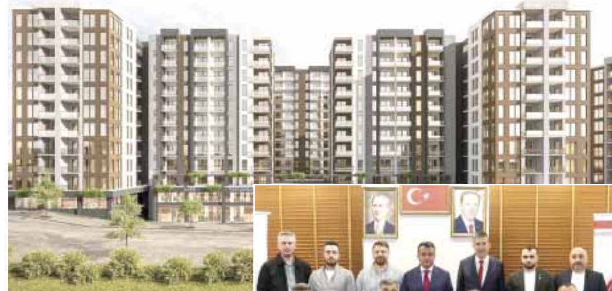
Kentsel Dönüşüm Projesi; Kadıköy Mahallesi, Zeytinlik Mahallesi, Anadolu Mahallesi, Hastanebaşı Mahallesi ve Kökçüoğlu Mahallesi olmak üzere toplam 5 mahalleyi kapsıyor.

Büyükşehir Belediye Başkanı Halit Doğan, kentsel dönüşüm projesinde müteahhit firmalarla ilk imzaların atıldığını açıklayarak, "Kimseyi yerinden etmeden, gönüllülük ve uzlaşılı temelde çalışıyoruz" dedi