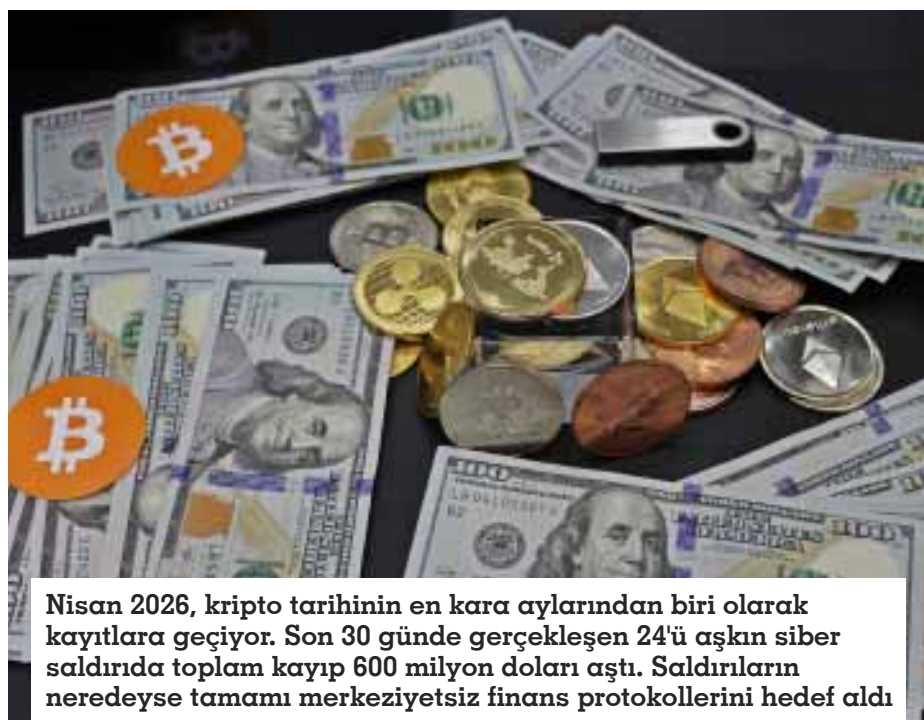
Nisan 2026, kripto tarihinin en kara aylarından biri olarak kayıtlara geçiyor. Son 30 günde gerçekleşen 24'ü aşkın siber saldırıda toplam kayıp 600 milyon doları aştı. Saldırıların neredeyse tamamı merkezileşmiş finans protokollerini hedef aldı