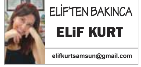
ELİFTEN BAKINCA ELİF KURT

planladık. Hem mevcut hastanemizdeki acil servis açık olacak hem de şehir hastanesindeki acil servis hizmet vermeye devam edecektir." ■ İHA