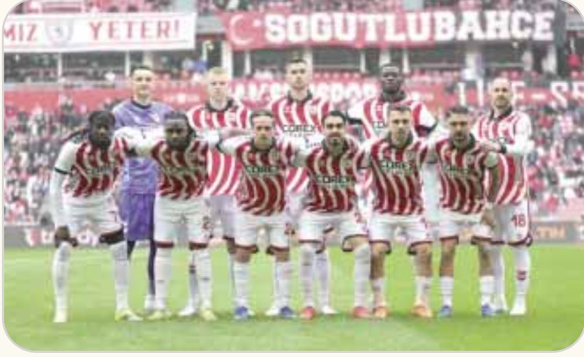
Samsunspor, önümüzdeki maçlarda alacağı sonuçlarla hem ligdeki konumunu sağlamlaştırmak hem de gelecek sezon için umut vermek istiyor.

Samsunspor, Trendyol Süper Lig'de 28. hafta itibarıyla 36 puanla 7. sırada yer alıyor. Son 15 maçında 2 galibiyet elde eden takım, kalan haftalarda performansını artırarak ligi en iyi yerde bitirmeyi hedefliyor