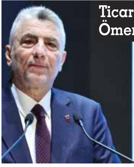
Ticaret Bakanı Ömer BOLAT: