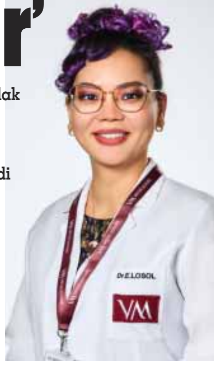
uyuşma, his kaybı veya geçmeyen deri lekeleri durumunda erken tanı için dermatoloji uzmanına başvurulması gerektiğini belirtti.