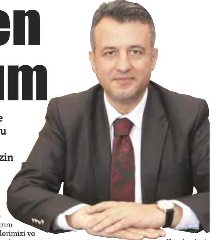
Cumhuriyet Bayramı'nı en içten dileklerle kutluyorum" dedi. ■ SBB BÜLTEN

başta ülkemizin kurucusu Gazi Mustafa Kemal Atatürk olmak üzere vatanımız için canlarını feda eden tüm şehitlerimizi ve gazilerimizi rahmet, minnet ve şükranla anıyorum. Milletimizin ve tüm hemşehrilerimizin 29 Ekim